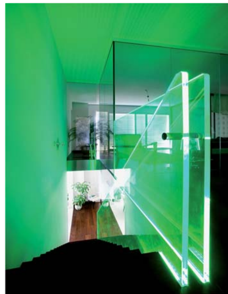
Eclairage LED intégré