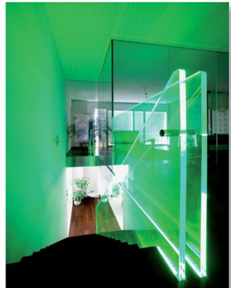
Eclairage LED intégré