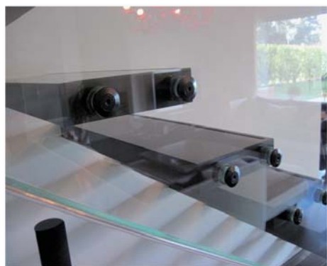
Détail de la fixation des marches