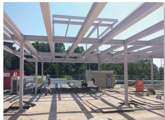
Toiture et superstructures surélévation