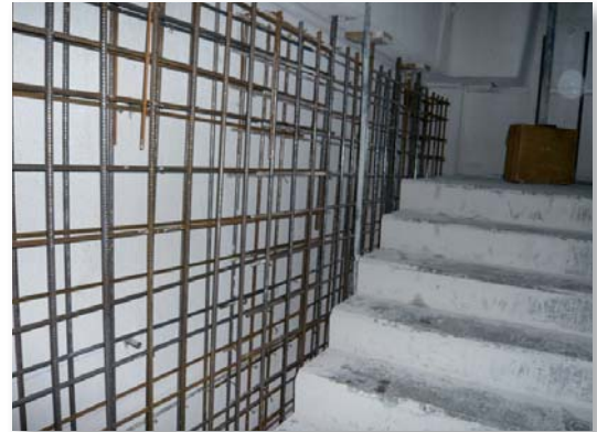
Nouveaux refends parasismiques