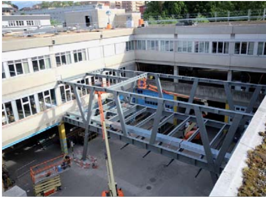
Montage du «pont» de liaison

Maître de l'ouvrage : Loterie Romande SA, Lausanne Architecte : CCHE Architecture et Design SA, Lausanne