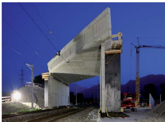
Nouveau tablier mis en place