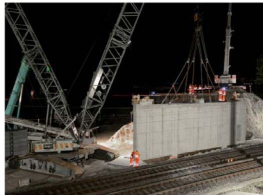
Pose de la culée Villeneuve