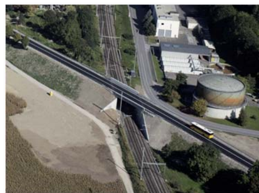
Ouvrage en service