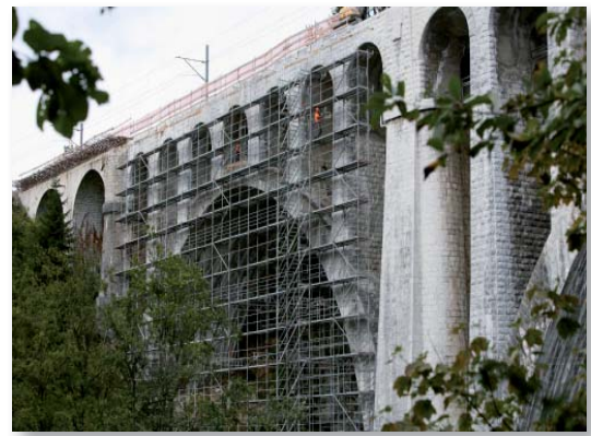
Assainissement de la maçonnerie