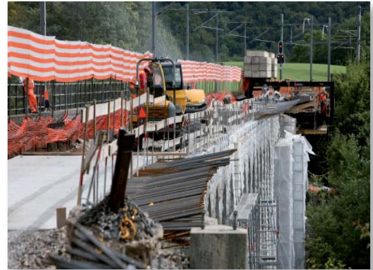
Réfection du tablier