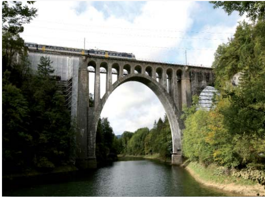
Vue d'ensemble du Viaduc

Maître de l'ouvrage : CFF SA Ingénieur civil : Daniel Willi SA, Montreux