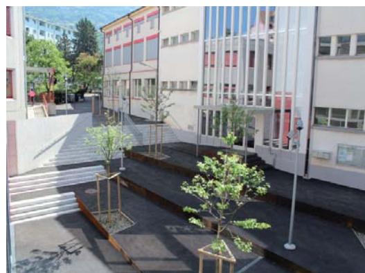
Préau entre la maison de quartier et le collège