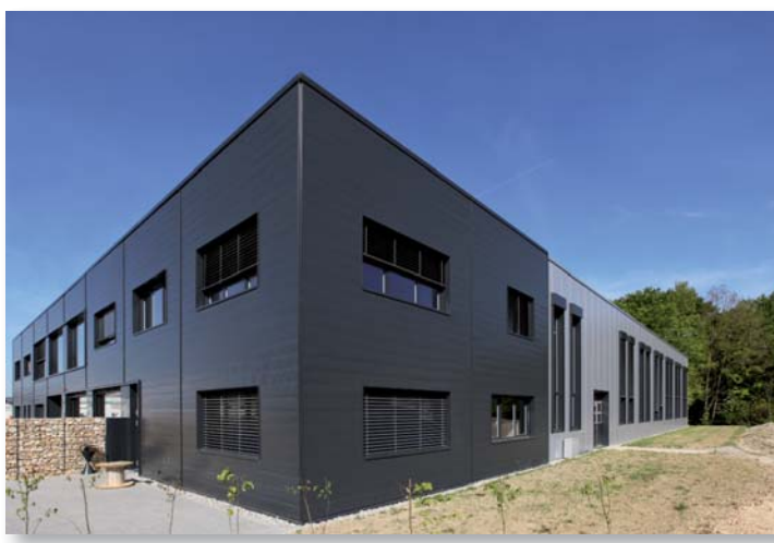
Vue d'ensemble halle